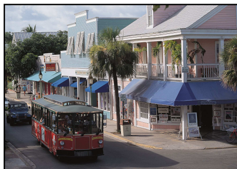
Duval Street, Key West