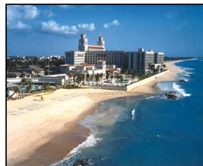
The Breakers, Palm Beach

Hôtels boutiques : The Colony Hotel (classé AAA 4 diamond) / Seagate Hotel & Spa (situé sur Delray Beach) / The Brazilian Court Hotel & Beach Club (à quelques pas de Worth Avenue)