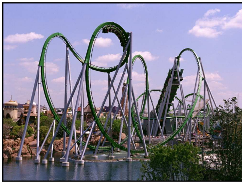
Hulk Coaster, Islands of Adventure

Avec 4 parcs à thème et 2 parcs aquatiques signés Walt Disney World Resort , Orlando s'est créé une belle notoriété. A voir : Magic Kingdom, Epcot, Animal Kingdom, Disney's Hollywood Studios, mais aussi Blizzard Beach et Typhoon Lagoon.