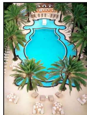
Raleigh Hotel, Miami

District Art Déco : Anglers Boutique Hotel / Raleigh Hotel / Sagamore Hotel (South Beach) / Daddy O (Bal Harbour) / Solé Hotel (Sunny Isles) www.uniquehotelsolutions.com